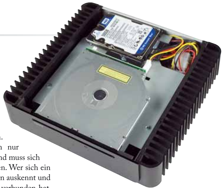
Im aktuellen Modell sitzt nur noch eine Festplatte mit 500-GB-Kapazität. Für Backups muss man eine externe Lösung finden

All die sauber eingelesenen Alben nützen den erdenklichen Streaming-Clients nicht viel, wenn sie nicht den passenden Server vorfinden. Erneute Entwarnung: Unser kleiner Kasten hat so ziemlich jeden aktuellen Server installiert und vorkonfiguriert, den man sich denken kann. Dazu gehören natürlich der universelle UPnP-Server, der schon mal einen Großteil handelsüblicher Empfänger abdeckt, hinzu kommen die speziellen Server für iTunes (FireFly) und das SqueezeCenter für die Logitech-Streaming-Clients. Auch die beliebten Sonos-Controller gehen nicht leer aus, die brauchen ja nur eine Ordnerfreigabe. Wie man das macht, steht in der Anleitung.