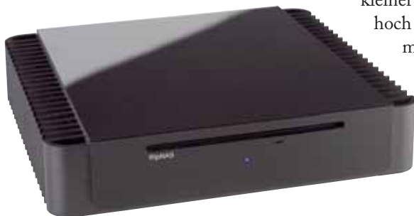
Der Z500 ist halbso hoch wie sein Vorgänger

E s hat sich einiges getan. Zunächst werden viele sich erst mal darüber freuen, dass der RipNAS jetzt viel kleiner ist. So ziemlich genau halb so hoch ist er nur noch. Das erreichte man, indem jetzt nur eine Festplatte im Inneren sitzt. Akustisch wird er auch keinen stören, seine Maße sind angenehm kompakt, außerdem ist er selbst im Betrieb so leise, dass man ihn gar nicht merkt. Seinem lüfterlosen Design sei Dank.